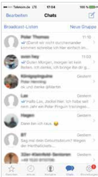
Beispiel der Benutzeroberfläche des Messengers „WhatsApp“

Wenn Sie SMS mit Ihrem Smartphone nutzen, wird Ihnen der Aufbau eines Messengers bekannt vorkommen. Sie sehen eine Liste mit den Personen, mit denen Sie Nachrichten ausgetauscht haben. Mit einem Klick auf den jeweiligen „Chat“ können Sie sich den Gesprächsverlauf der Vergangenheit ansehen und neue Nachrichten verfassen. Da die Messenger meist mit dem Adressbuch Ihres Telefons verknüpft werden, können Sie bei allen Kontakten in Ihrem Handy sehen, ob diese den Messenger nutzen und diese dann direkt anschreiben. Eine Extra-Adresse – vergleichbar mit einer E-Mail-Adresse – benötigen Sie nicht.