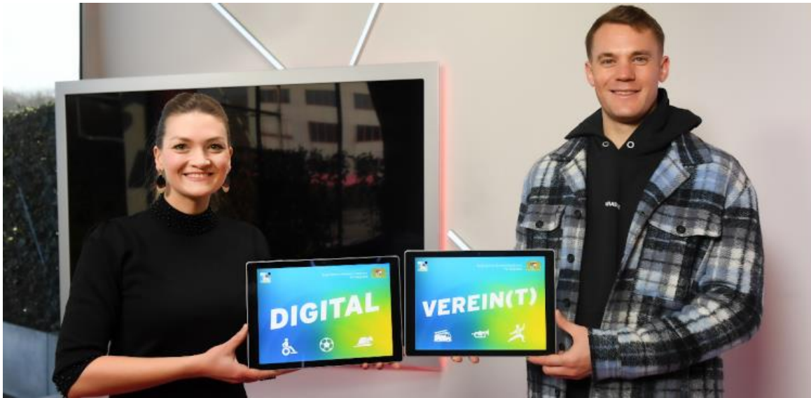
Die bayerische Staatsministerin Judith Gerlach und Projektpate Manuel Neuer zum Start von digital verein(t)

„digital verein(t)“ startet in diesem Sommer als neue bayerische Landesinitiative im Bundesnetzwerk Digitale Nachbarschaft (DiNa) . Seit 2015 unterstützt die DiNa engagierte Bürger:innen und Vereine darin, digitale Kompetenzen für den täglichen Bedarf zu erlernen und weiterzuvermitteln. „digital verein(t)“ baut auf dieses Netzwerk auf und stellt IT-Sicherheitswissen gezielt für Engagierte in Bayern zur Verfügung. Gefördert wird die Landesinitiative durch das Bayerische Staatsministerium für Digitales und durchgeführt in enger Kooperation mit der Landesarbeitsgemeinschaft der Freiwilligenagenturen und -zentren (lagfa bayern e.V.). Projektpate ist der Kapitän der deutschen Männer-Fußballnationalmannschaft Manuel Neuer.