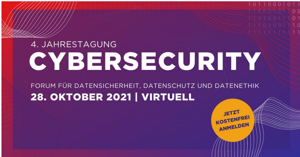
Foto: Convent 4. Jahrestagung Cybersecurity

Zum 4. Mal in Folge diskutieren rund 350 IT-Expert:innen sowie Sicherheitsverantwortliche aus Konzernen, politischen Institutionen und wissenschaftlichen Einrichtungen darüber, ob und wie Cyberkriminalität in den Griff zu bekommen ist. Des Event schafft ein Forum für Datensicherheit, Datenschutz und Datenethik.